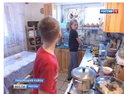
Совместное приготовление пищи