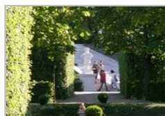
parques y zonas